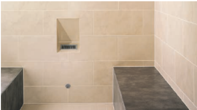
Hamмам Hombre, Catalogue page 140