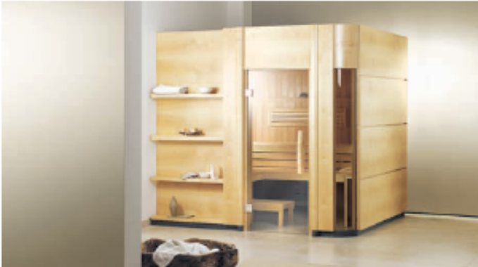
Modèle 23.27, Catalogue page 86 ( montré avec options )